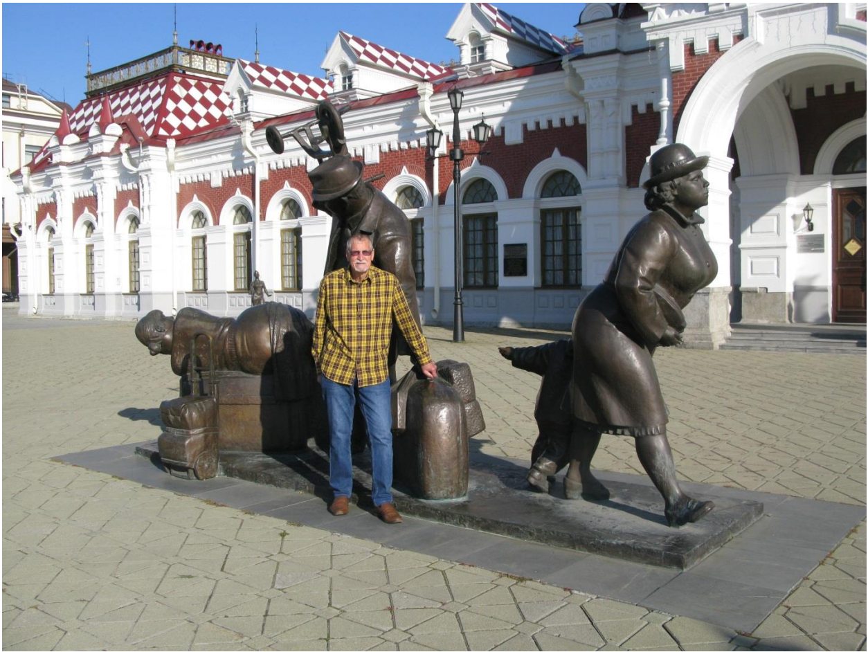
Перед отъездом домой. У старого вокзала.