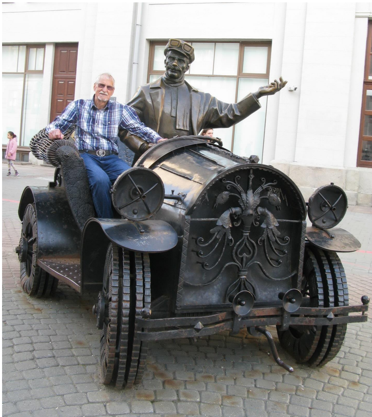
Эх, прокачу! Рядом с бывалым шофером.