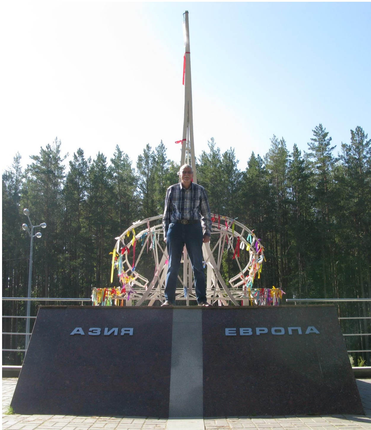
У обелиска «Европа – Азия».