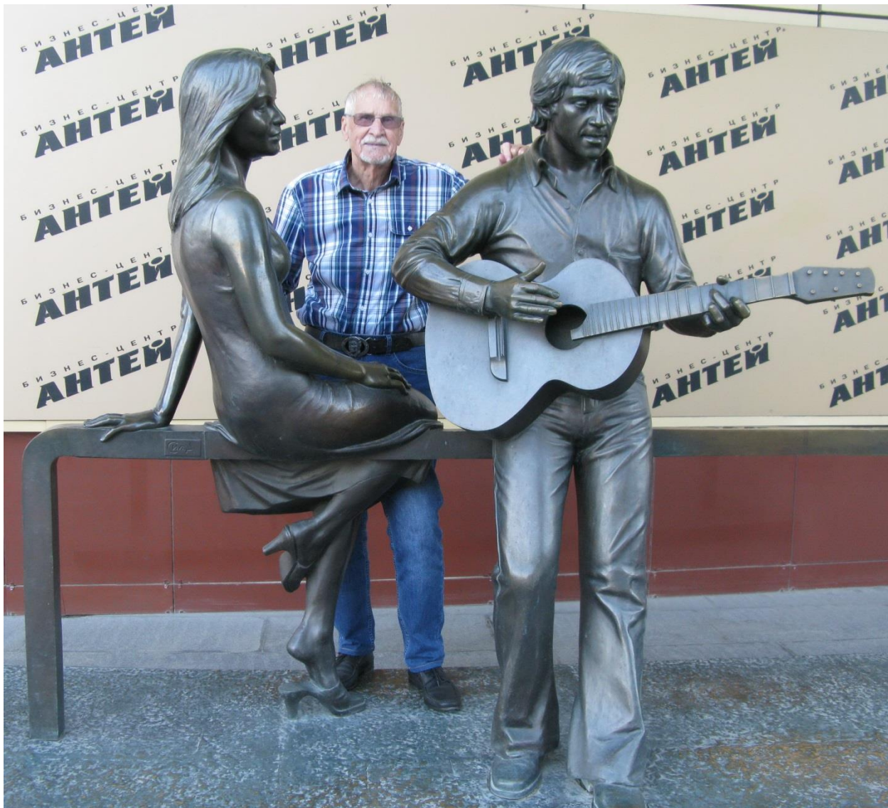
В компании с В. Высоцким и М. Влади.