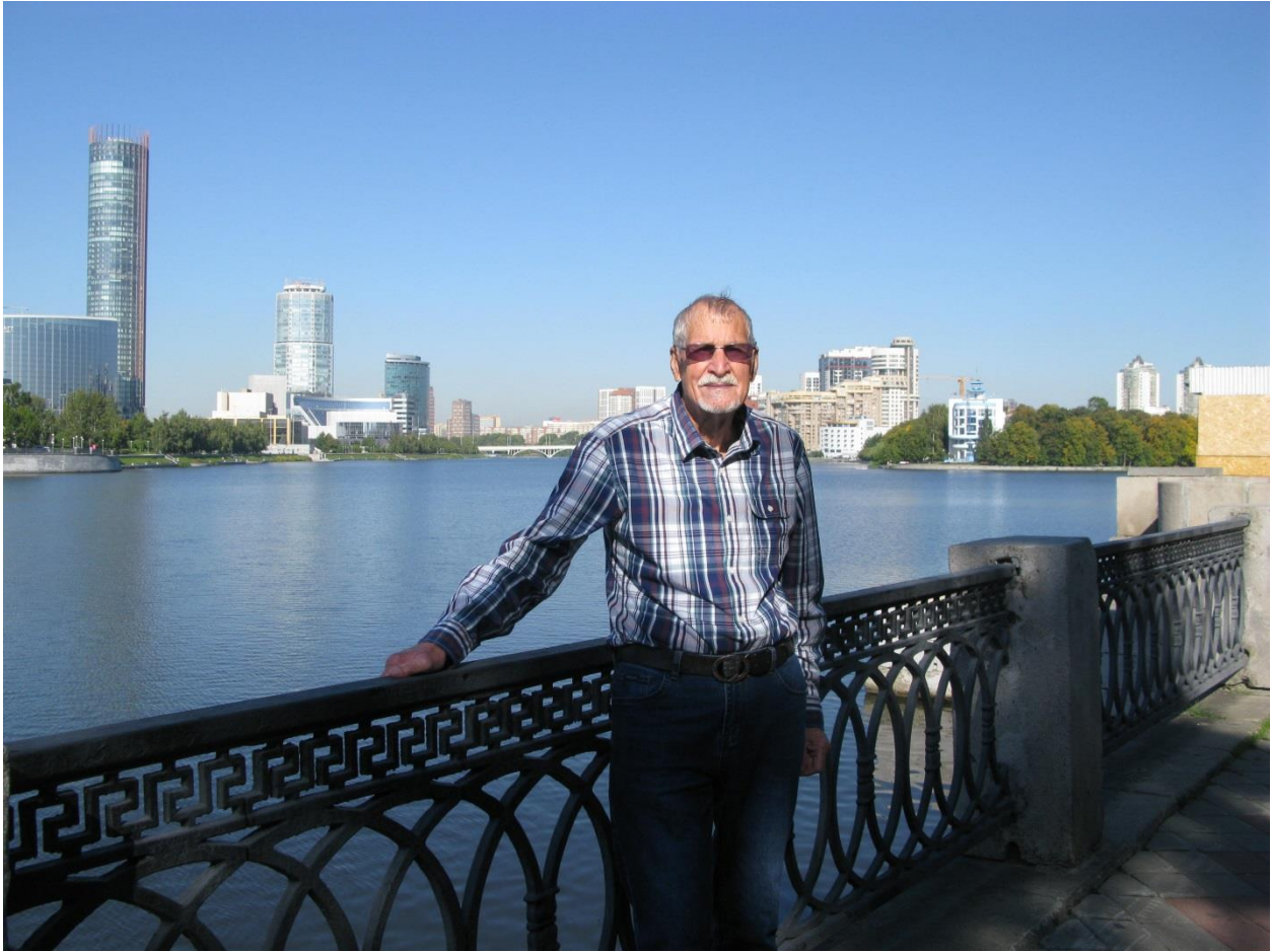
За спиной возвышается небоскреб «Исеть».